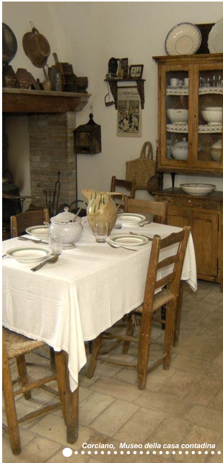
Corciano, Museo della casa contadina