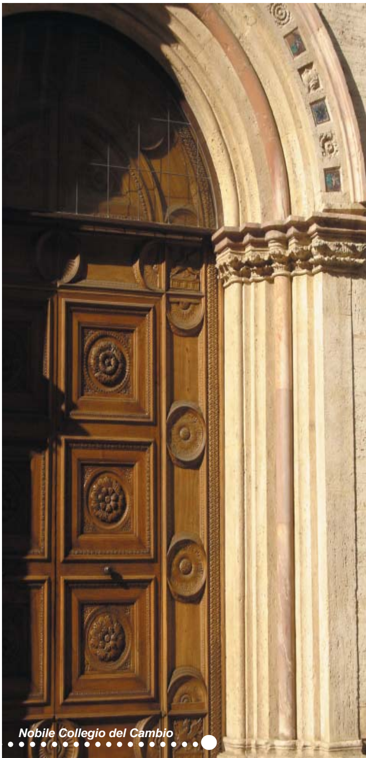
Nobile Collegio del Cambio