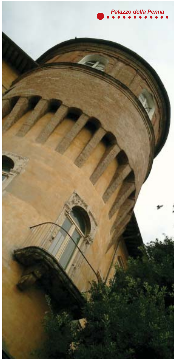
Palazzo della Penna