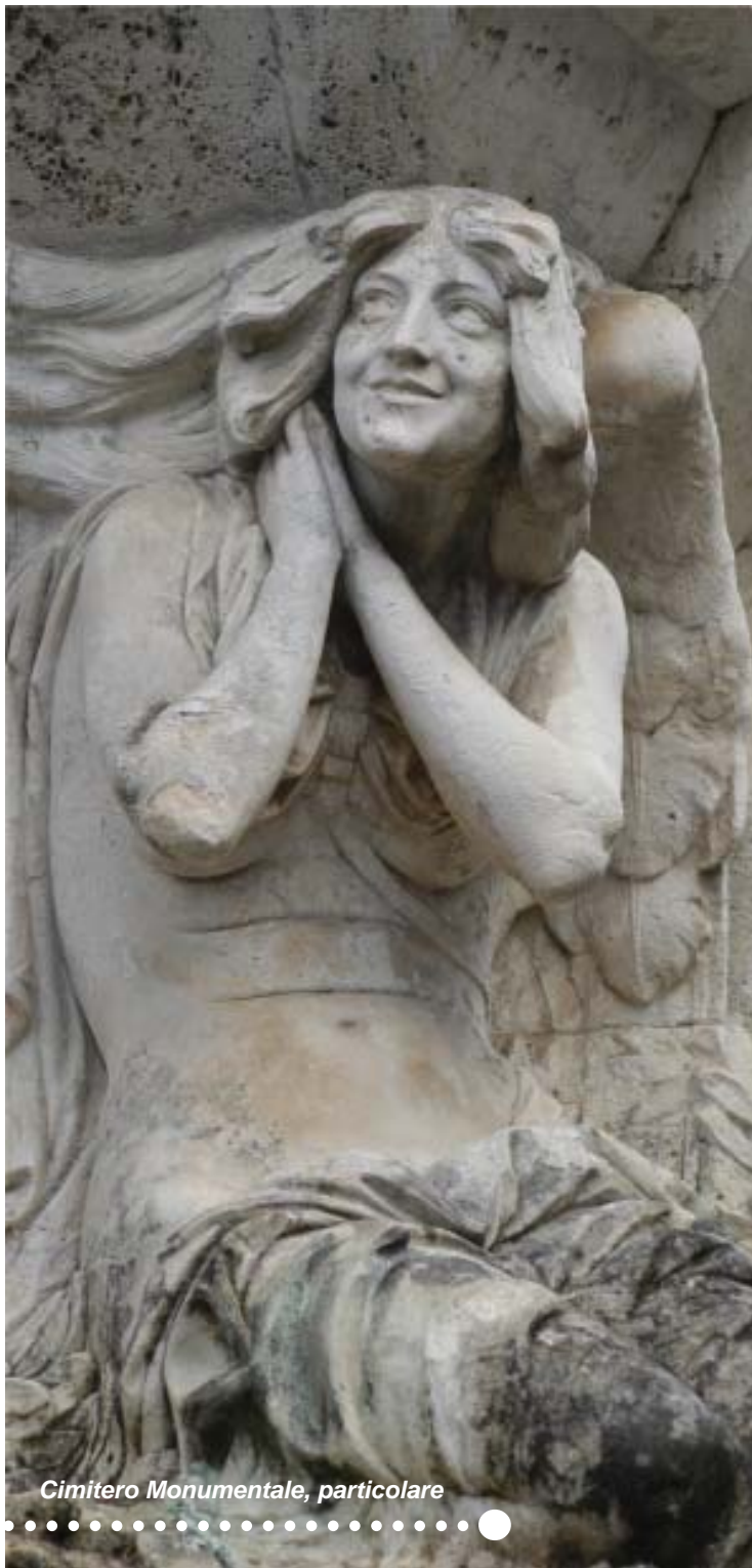
Cimitero Monumentale, particolare