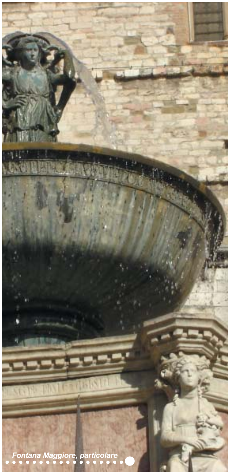
Fontana Maggiore, particolare